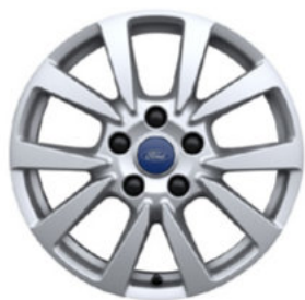
16" OBRĘCZE ZE STOPÓW LEKKICH 1 400,- dla wersji Trend Standard dla wersji Limited