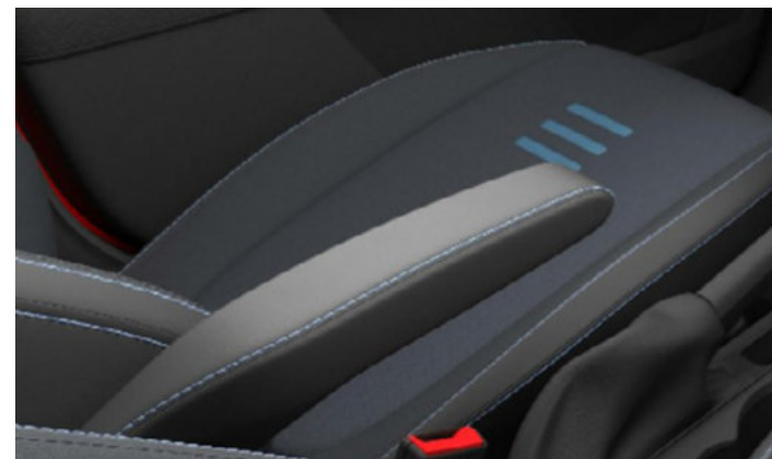
TAPICERKA MATERIAŁOWA Z NIEBIESKIMI AKCENTAMI Standard dla wersji ACTIVE