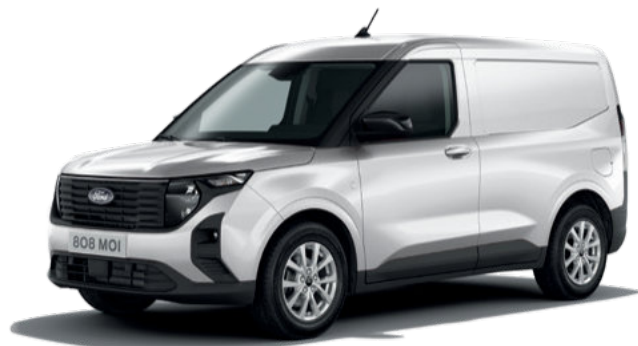
FROZEN WHITE - LAKIER ZWYKŁY bez dopłaty