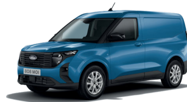
DESERT ISLAND BLUE - LAKIER METALIZOWANY 1 400,-