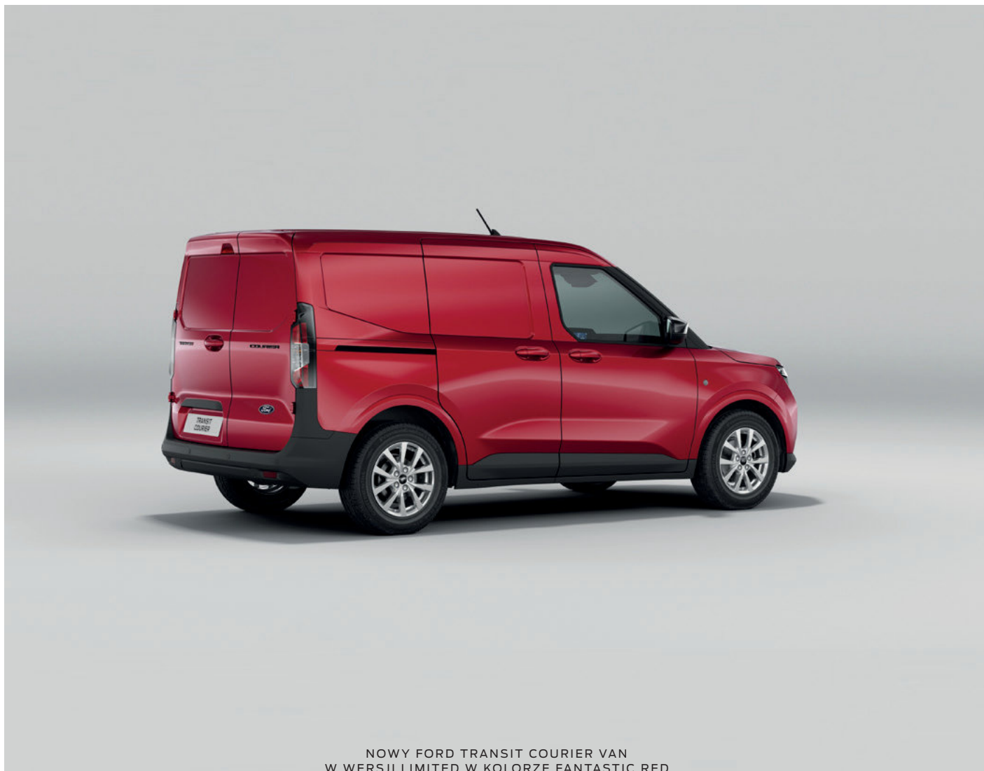
NOWY FORD TRANSIT COURIER VAN W WERSJI LIMITED W KOLORZE FANTASTIC RED