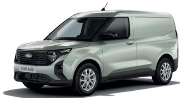
CACTUS GRAY - LAKIER ZWYKŁY bez dopłaty