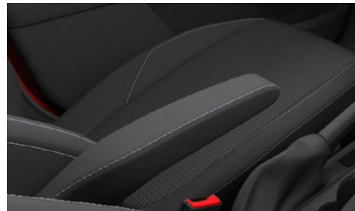
TAPICERKA MATERIAŁOWA W CIEMNEJ TONACJI Standard dla wersji TREND