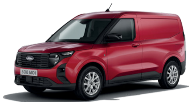
FANTASTIC RED - LAKIER METALIZOWANY 1 400,-