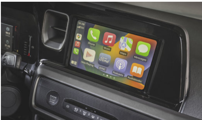
BEZPRZEWODOWA OBSŁUGA APPLE CARPLAY I ANDROID AUTO Standard