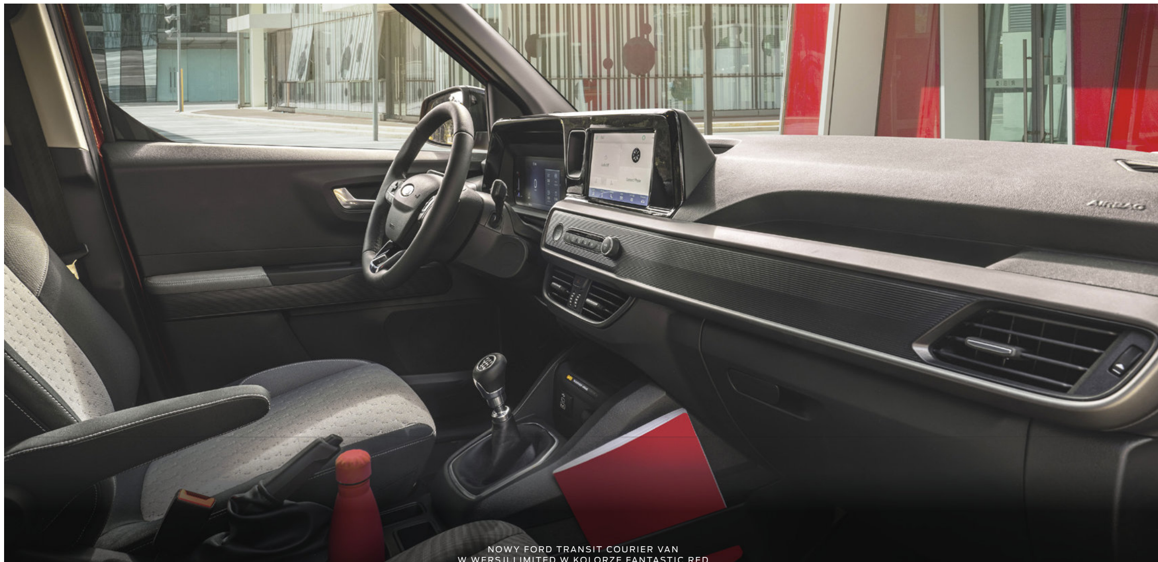
NOWY FORD TRANSIT COURIER VAN W WERSJI LIMITED W KOLORZE FANTASTIC RED