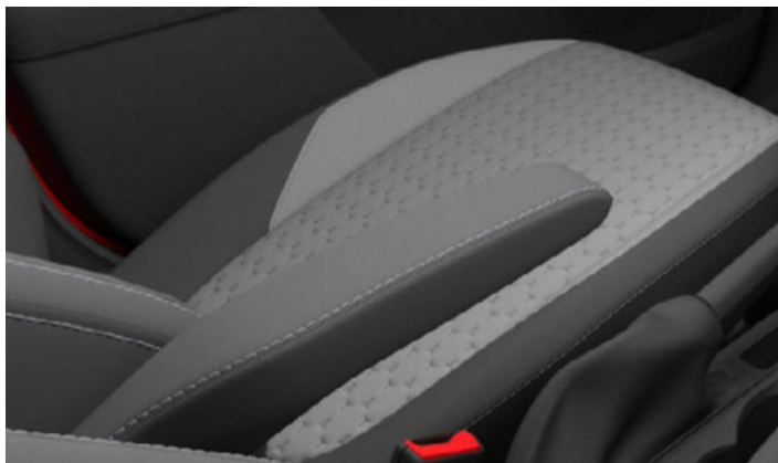
TAPICERKA MATERIAŁOWA W JASNEJ TONACJI Standard dla wersji LIMITED