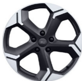
17" OBRĘCZE ZE STOPÓW LEKKICH Standard dla wersji Active