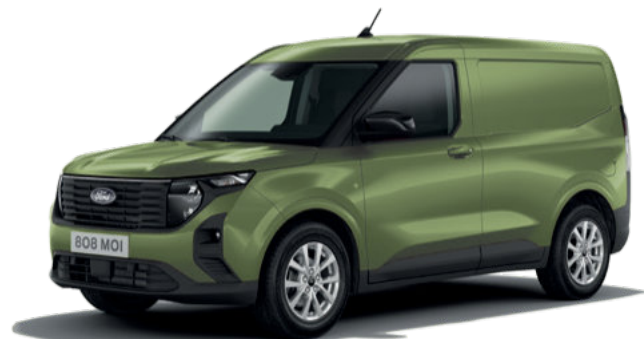
BURSTING GREEN- LAKIER METALIZOWANY 1400,-