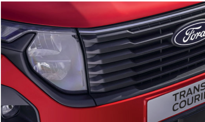
REFLEKTORY PRZEDNIE HALOGENOWE - ZE ŚWIATŁAMI DO JAZDY DZIECNEJ LED 600,- dla wszystkich wersji