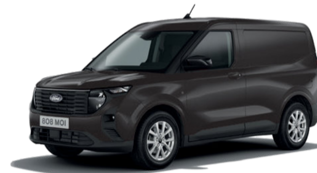
AGATE BLACK- LAKIER METALIZOWANY 1 400,-